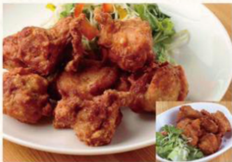
鶏唐揚げ 770円 (税抜) [ 847円(税込) ] 鶏唐揚げ(小) 570円 (税抜) [ 627円(税込) ]