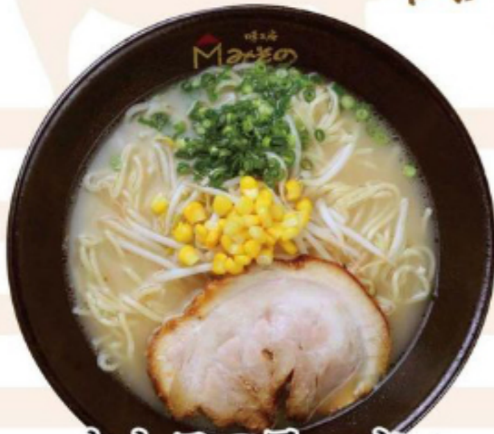
とんこつラーメン

呼香、鶏ガラ、 香味野菜を つとつと12時間 煮込んだうま味 濃縮白湯スープと、 のびのびとした 甲斐ストリート 麵が特徴 パツパツの 東京風の玉葱 ラーメンです。