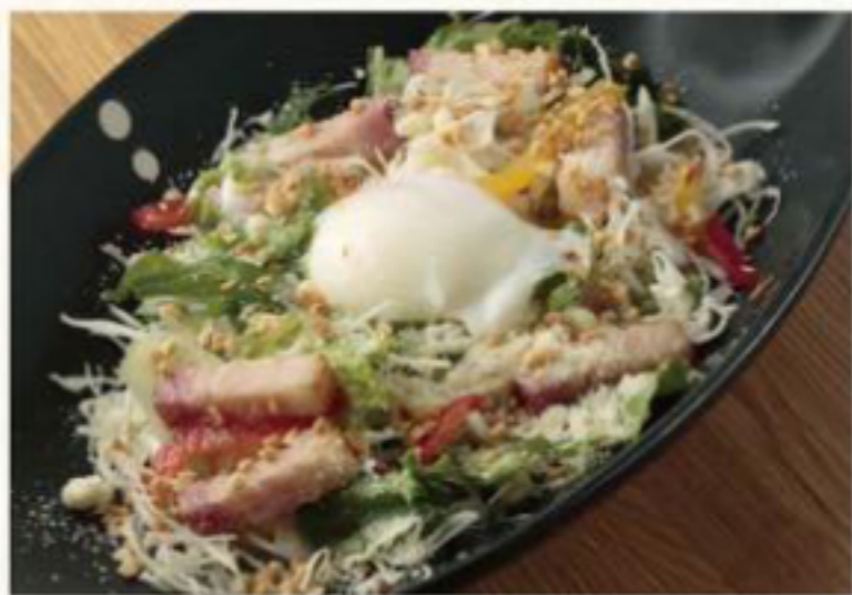
シーザーサラダ 770円 (税抜) [ 847円(税込) ]