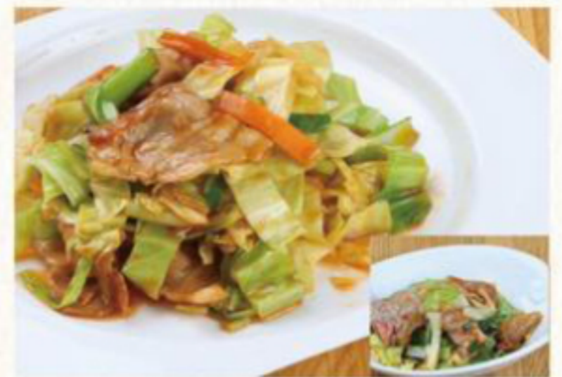
肉野菜炒め 720円 (税抜) [ 792円(税込) ] 肉野菜炒め(小) 520円 (税抜) [ 572円(税込) ]