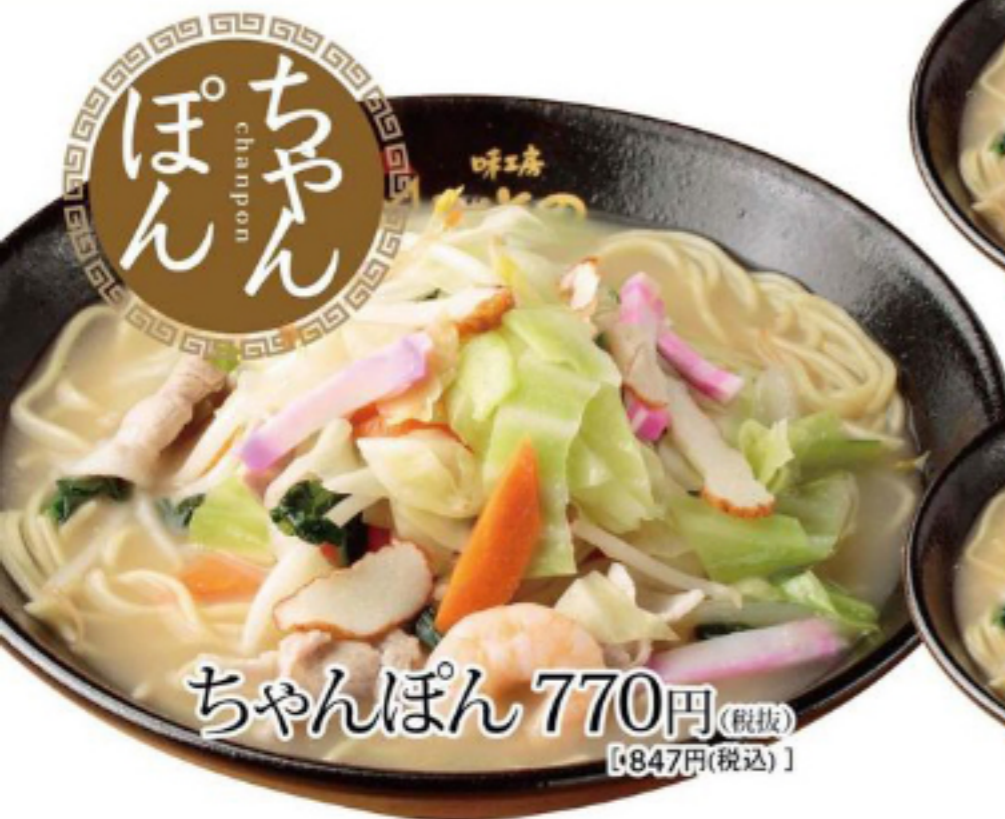
ちゃんぽん 770円(税抜) [847円(税込)]