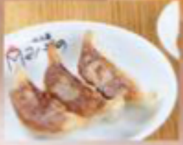
黒豚餃子 350円 (税抜) [ 385円(税込) ] 黒豚餃子(小) 250円 (税抜) [ 275円(税込) ]