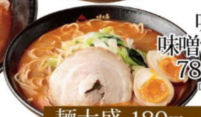
味玉 味噌ラーメン