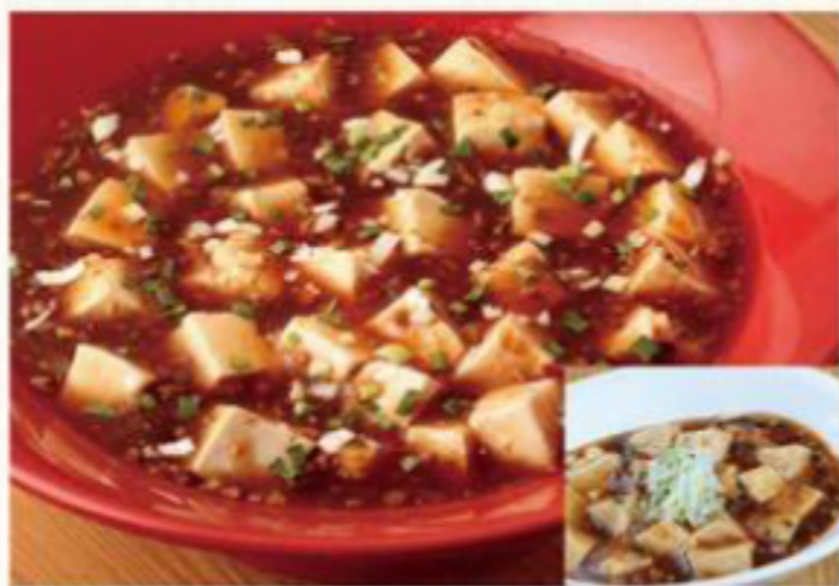
麻婆豆腐 770円 (税抜) [ 847円(税込) ] 麻婆豆腐(小) 570円 (税抜) [ 627円(税込) ]