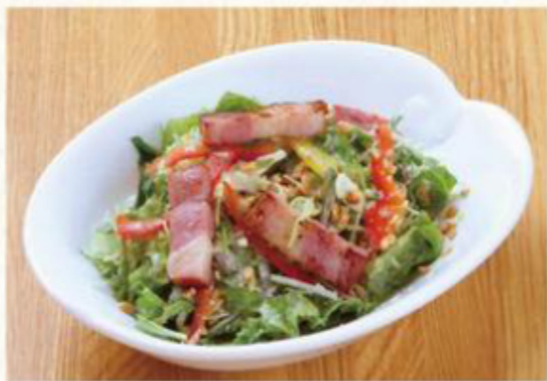
シーザーサラダ(ミニ) 370円 (税抜) [ 407円(税込) ]