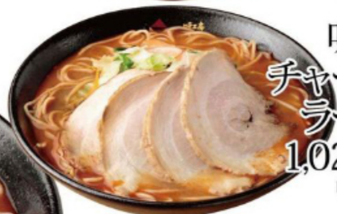
味噌 チャーシュー ラーメン