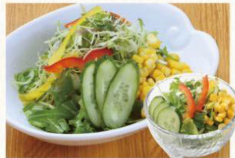
グリーンサラダ 340円 (税抜) [ 374円(税込) ] グリーンサラダ(ミニ) 170円 (税抜) [ 187円(税込) ]