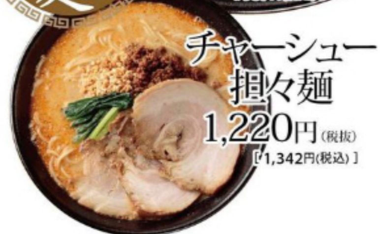
チャーシュー 担々麵