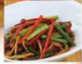
5/8 サイズで お一人様用 食べきり単品も ございます！ 牛とニンニクの芽の炒め 1,020円 (税抜) [ 1,122円(税込) ] 牛とニンニクの芽の炒め(小) 800円 (税抜) [ 880円(税込) ]