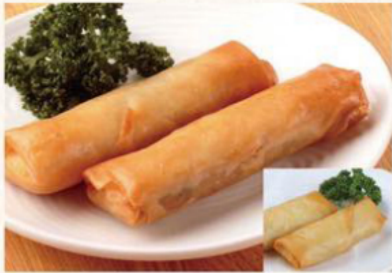
五目春巻き 370円 (税抜) [ 407円(税込) ] 五目春巻き(小) 300円 (税抜) [ 330円(税込) ]