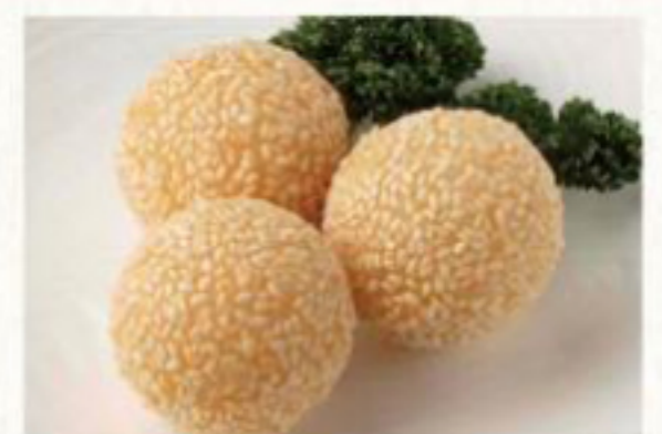
ゴマ饅頭 400円 (税抜) [ 440円(税込) ]