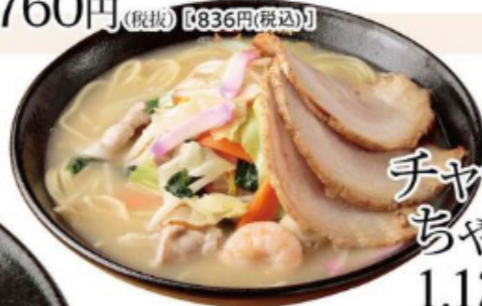
チャーシュー ちゃんぽん