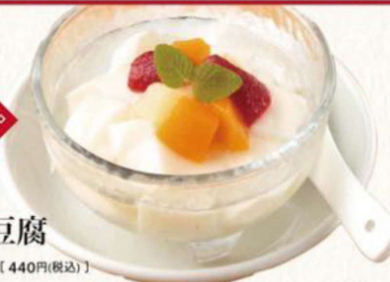
杏仁豆腐 400円 (税抜) [ 440円(税込) ]