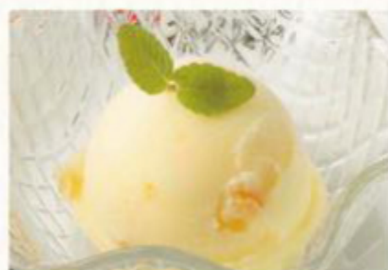
季節のシャーベット 150円 (税抜) [ 165円(税込) ]