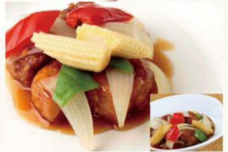
酢豚 900円 (税抜) [ 990円(税込) ] 酢豚(小) 700円 (税抜) [ 770円(税込) ]