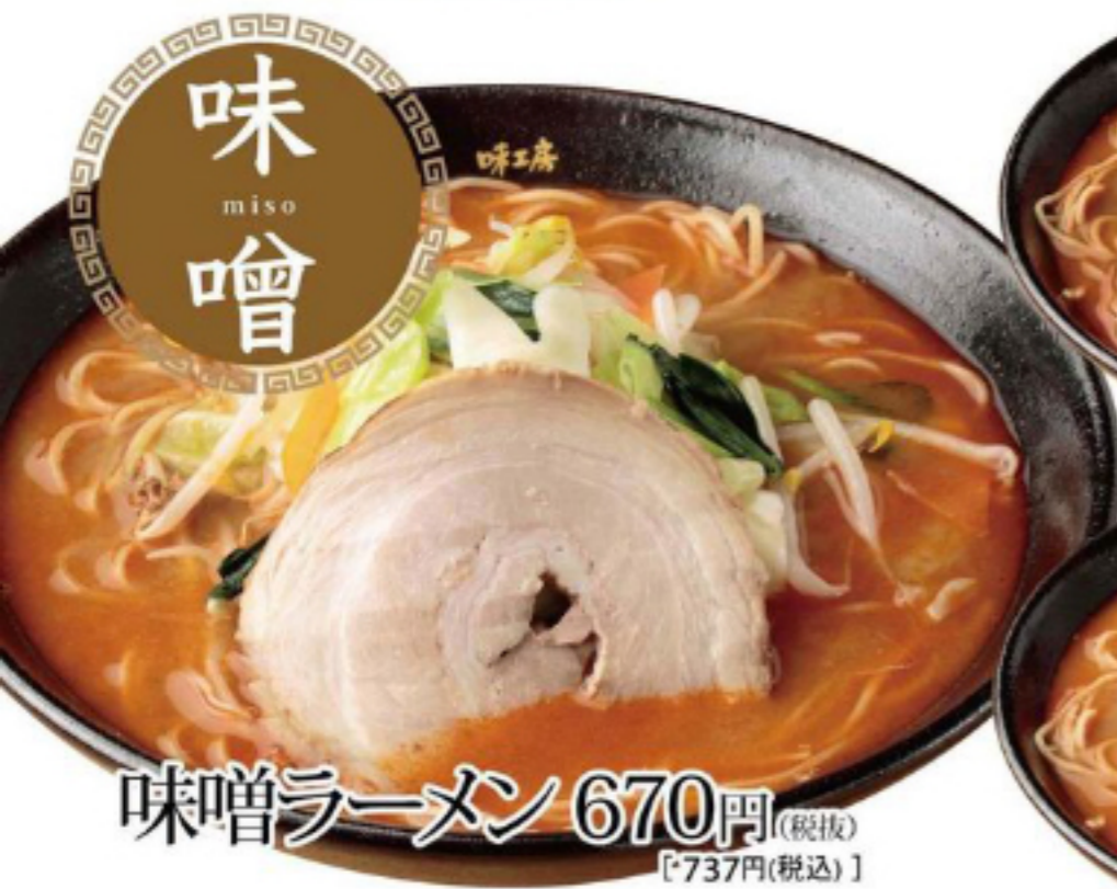
味噌ラーメン 670円(税抜) [737円(税込)]