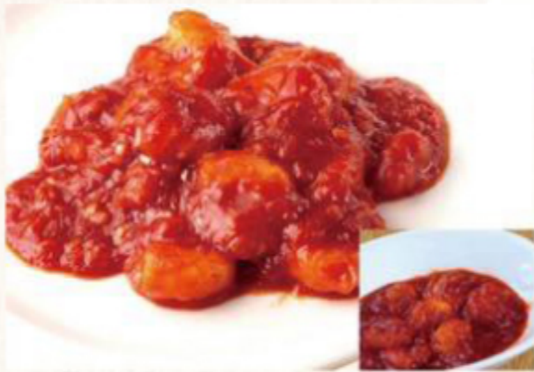
エビチリソース 1,220円 (税抜) [ 1,342円(税込) ] エビチリソース(小) 820円 (税抜) [ 902円(税込) ]