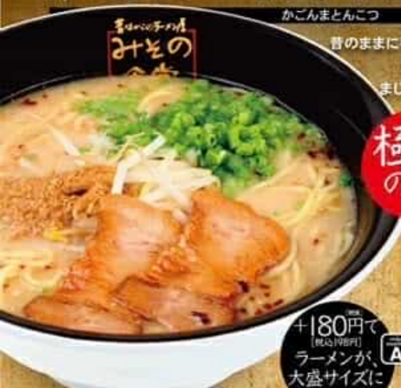
かごんまとんこつ

昔のままに手間ひまかけて地産地消(本物)の材料をたっぷり使ってコトコト羽釜で炊き上げたまじりっ気のない鹿児島(本物)のおいしさ。厳選国産小麦をブレンドした電子イオン水仕込みの麺は、スープとの相性も抜群です!