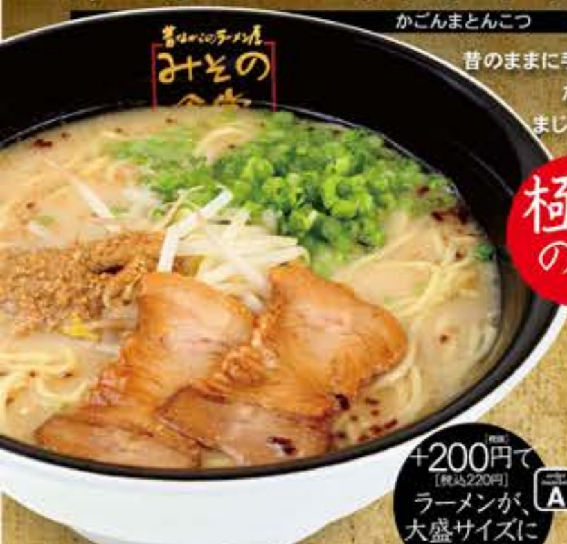
かごんまとんこつ

昔のままに手間ひまかけて地産地消(本物)の材料をたっぷり使ってコトコト羽釜で炊き上げたまじりっ気のない鹿児島(本物。)のおいしさ。厳選国産小麦をブレンドした電子イオン水仕込みの麺は、スープとの相性も抜群です!